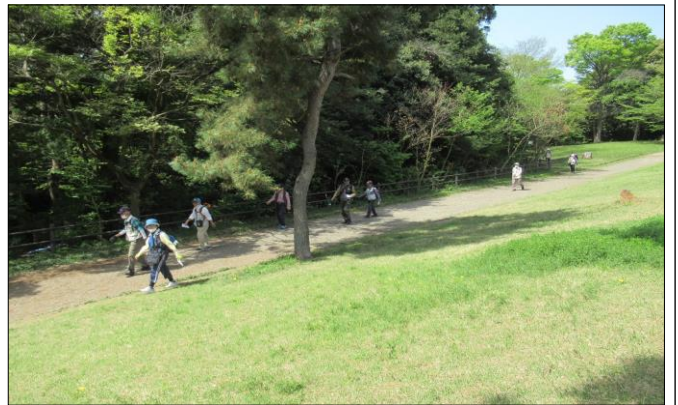
〈『旭区のこども自然公園へ』(緑道⑬) 2023.4.11〉 横浜で最大級の大きな公園で、緑でいっぱいでした