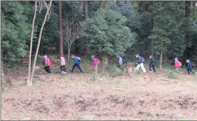
〈『矢指市民の森を歩く』 2023.3.14〉 曇り空で少し寒かったがウォーキングには快適でした