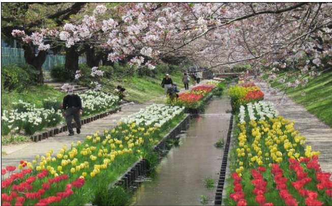
〈『江川のチューリップを見に行こう』 2023.4.5〉 今年も、好天に恵まれチューリップと桜の競演を堪能 できました