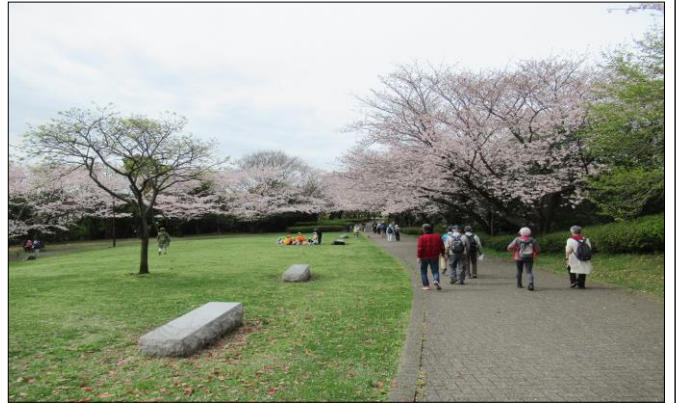
〈『シドモア桜ウォーク』 2023.3.27〉 本牧山頂公園の満開のソメイヨシノ