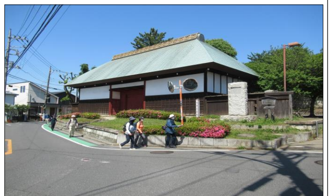
〈『入江川のせせらぎ緑道』 2023.5.10〉 快晴の中、横浜市の歴史的建造物の「馬場の赤門」 前を通るウォーカーの皆さん