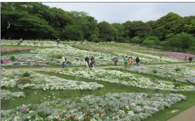
〈『四季の森・里山ガーデン』 2023.4.23〉 今年の大花壇のテーマは「爽快の丘」ということで「白 い花々」が主役でした