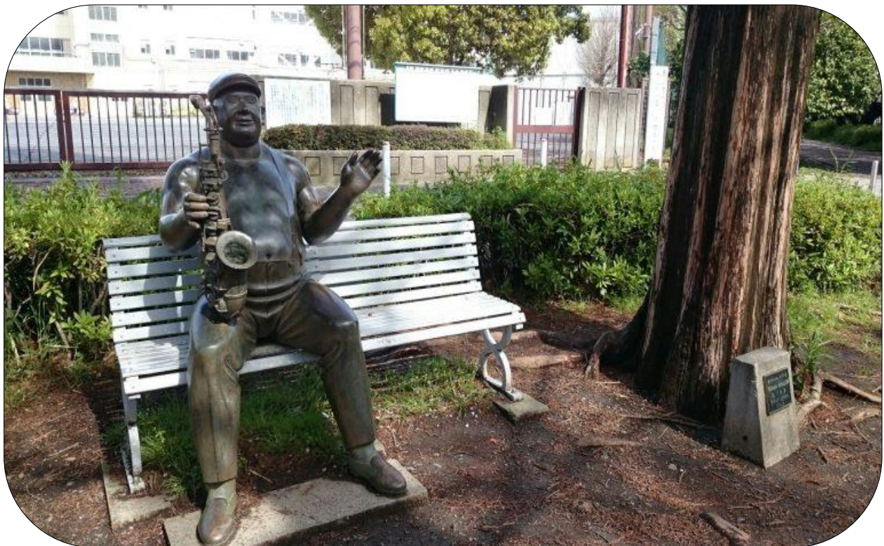
〈 太尾堤緑道のパブリックアート 〉

YWA ホームページアドレス URL http://kanagawaken-wa.sakura.ne.jp/ywaindex.html